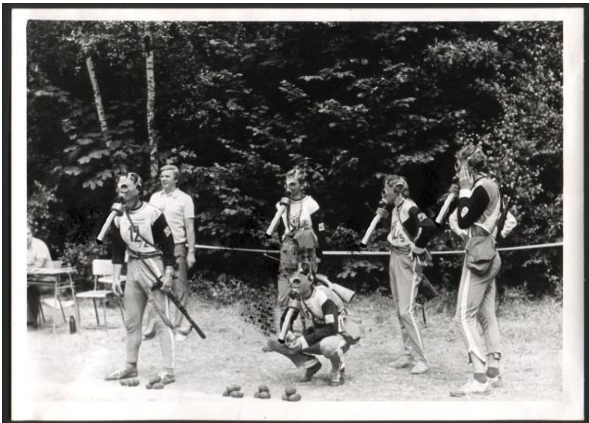
Finální disciplína. Kouření třístovkového džojnta skrz filtr na plynové masce. Nejnebezpečnější a nejvyčerpávající úkol. Na závodníkovi vpravo je dobře vidět, že mu maska netěsní a proto se snaží zabránit unikání kouře vlastními silami. Komise vlevo hodnotila eleganci kouření a samozřejmě řídila časomíru. Na této fotografii je výborně patrná tehdejší huličská móda sovětských tepláků a slušivých deček s čísly.