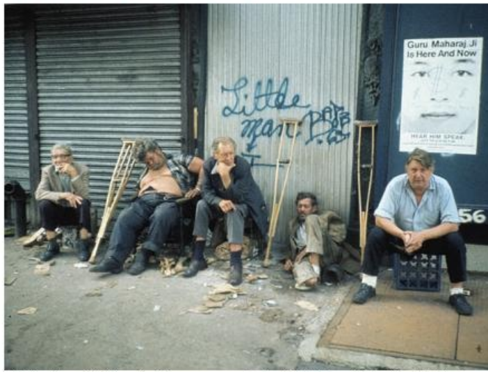
Pět účesů nové kolekce Art Shape v provedení našich špičkových kadeřníků, členů české sekce HCF.

Kolekci, ve které převažují oblé i rovné ofiny a střihy mikád, nazvali Art Shape a nápadité přehlídky pak jen uměleckou výtvarnost střihů potvrdily. Zároveň ukázaly, jak odvážné mohou být vlasové květinové fantazie.