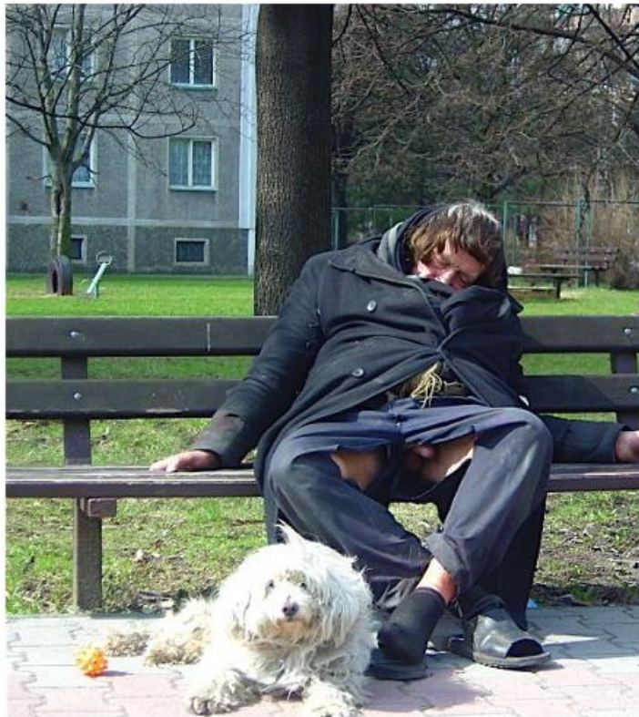
Asymetrické mikádo ve spojení se vzdušným oblečením a společnost nejlepšího přítele člověka bude dozajista hitem letošního léta.

„V délce je dovoleno vše - od velmi krátkých vlasů přes středně dlouhé mikádo až po dlouhé, podle stylu ženy a toho, čemu dává přednost a co jí sluší. Barvy jsou decentní, avšak s pastelově nápaditými efekty do květinových tónů.“