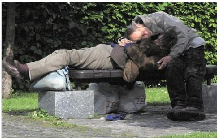
Alternativní šatní skříň: jednoduchá, přehledná, cenově dostupná. Skvěle nahradí nábytkové skříň či vestavěné šatny.

Bydlení v pronájmu je obvykle dočasné řešení. Byt, který nám neříká Pane, si vybíráme podle aktuální situace. Jak to vše zvládnout na pětníku a za malý obnos? Máme tu pár rad a inspirací.